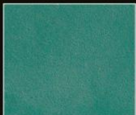
BT 10 TURCHESE