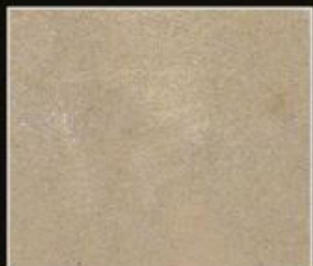
BT 04 TORTORA