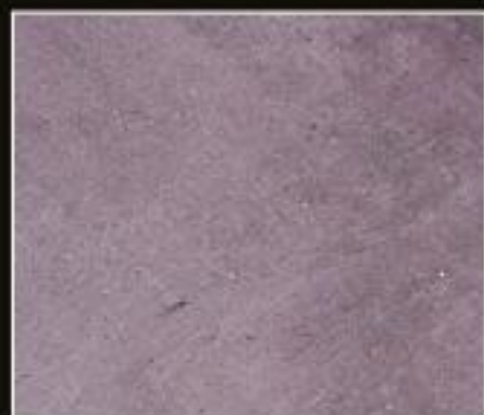
BT 05 VIOLA