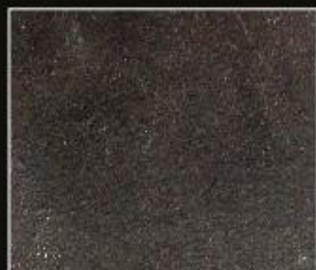
BT 12 ANTRACITE