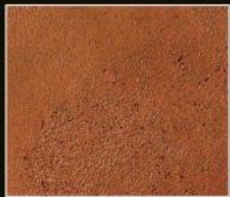
BT 01 RUGGINE