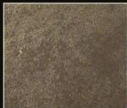
BT 06 FANGO