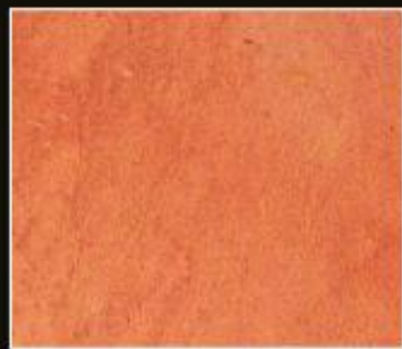
BT 02 ARANCIO