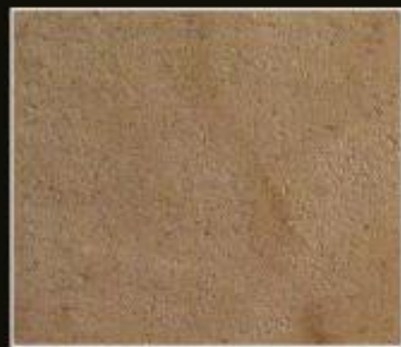
BT 03 TERRA