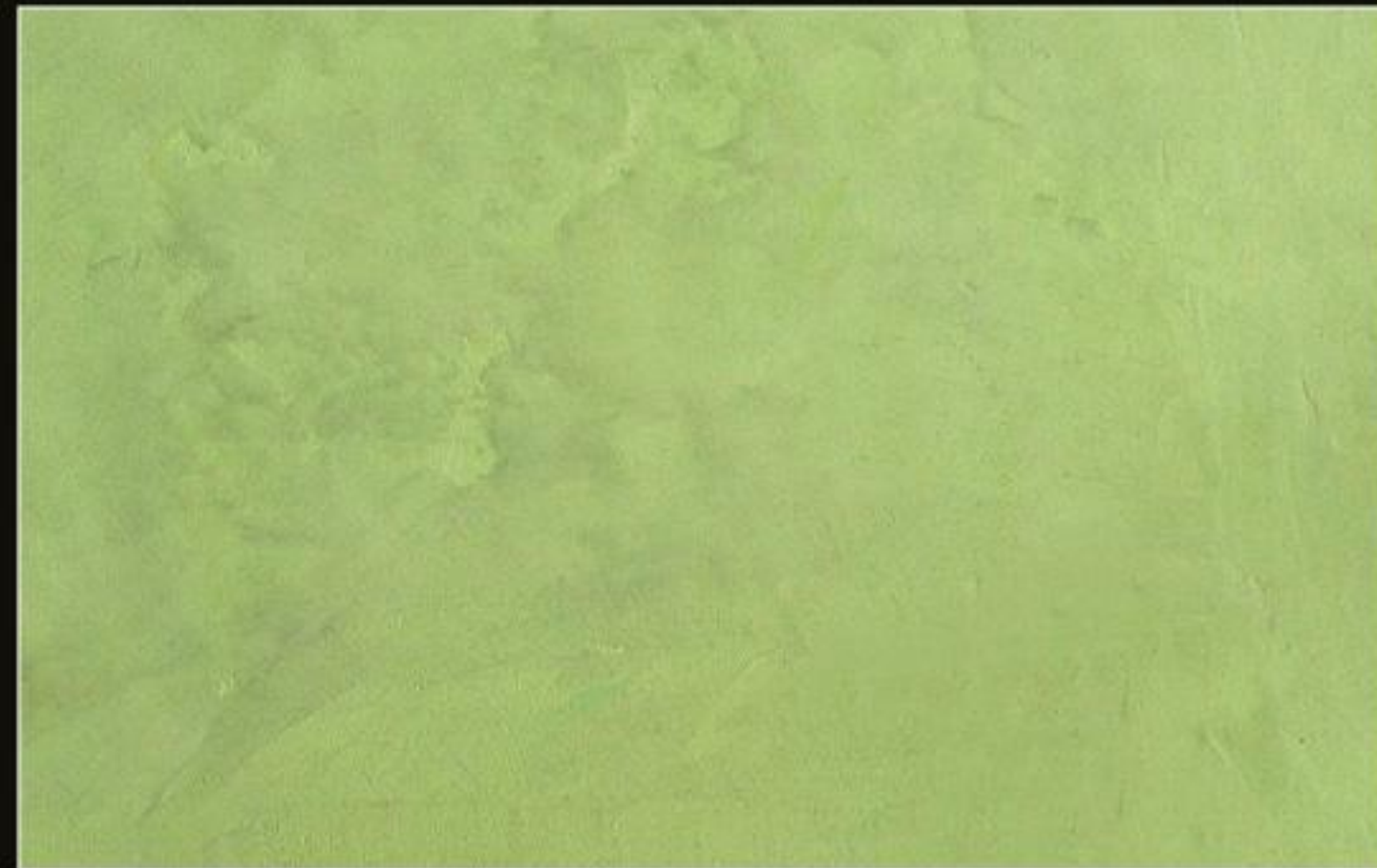
BT 14 VERDE ACIDO