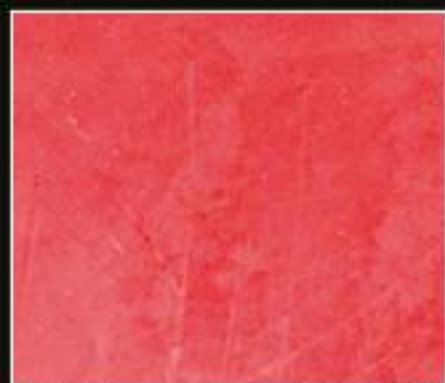
BT 08 POMPEI