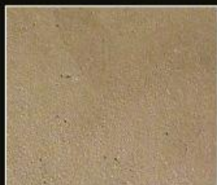
BT 11 SABBIA