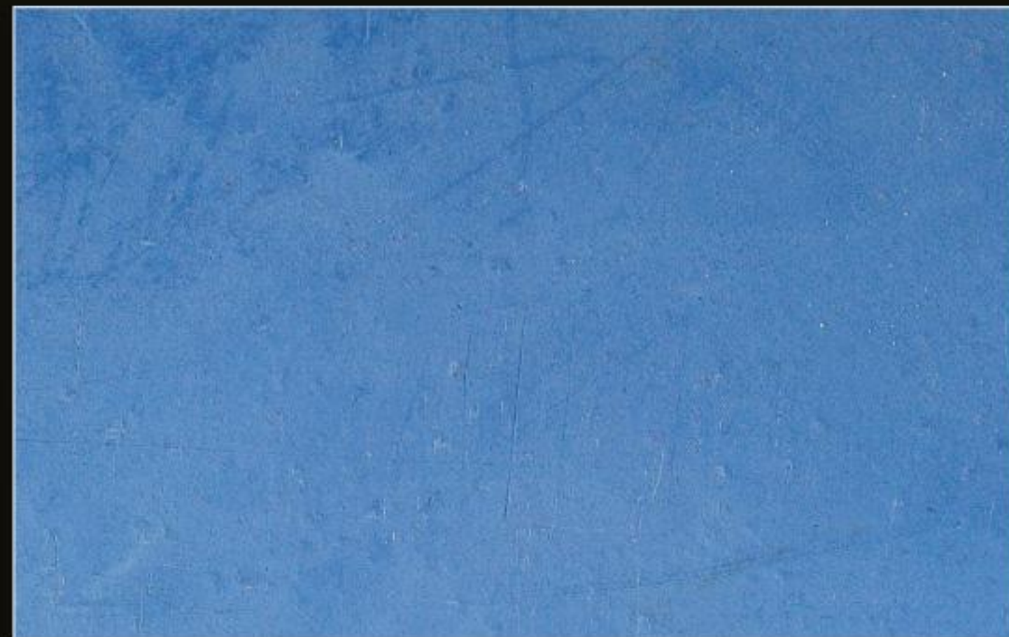
BT 13 BLU OLTREMARE