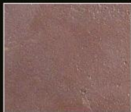
BT 09 BRONZO